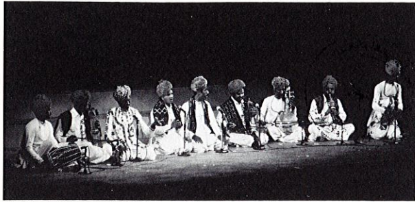
ランガとマンガニヤール合同演奏 Langa and Manganiyar